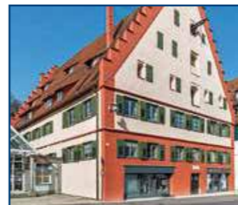
Café „Süßes Löchle“