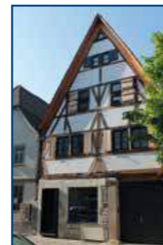
Ehemaliger Salzstadel Biberach | 1503