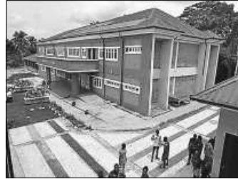
Letzte Vorbereitungen im Hof vor dem Hauptgebäude

Auf der Nordseite des Hofes, also rechts neben dem Hauptgebäude, befindet sich ein zweistöckiges Haus für Labortechnik, DEM eigentlichen Herzstück der Hochschule. Hier stehen den Studierenden kostspielige, hochsensible Geräte zur Verfügung. Diverse Unterrichts- und Seminarräume für die Fachrichtungen Biologie, Chemie, Biochemie und Physik sind nahezu eingerichtet.