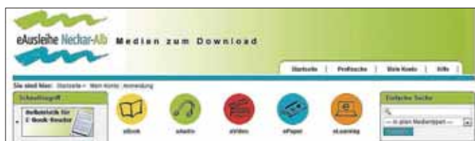
Startseite der eAusleihe Neckar-Alb

Die eAusleihe erreicht man entweder über die Website www.hirrlingen.de oder direkt über www.onleihe.de/neckar-alb .