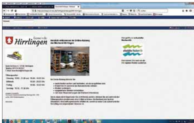
Startseite des Online-Katalogs Web-OPAC

Den Online-Katalog kann man z.B. über die Website www.hirrlingen.de (Rubrik "Lebenswertes Hirrlingen" > "Kinder, Jugend & Bildung" > "Bücherei") aufrufen.