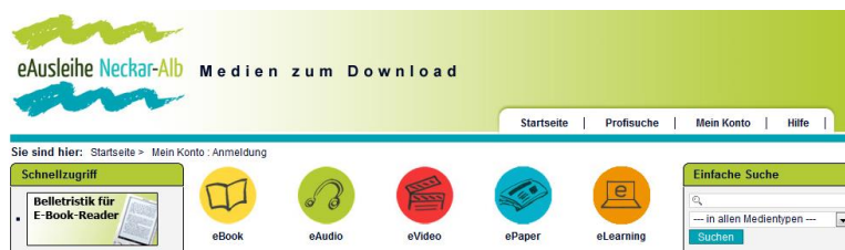
Startseite der eAusleihe Neckar-Alb

Oder Sie wählen den direkten Einstieg über www.onleihe.de/neckar-alb und sehen auf dieser Seite dann ausschließlich die digitalen Medien.